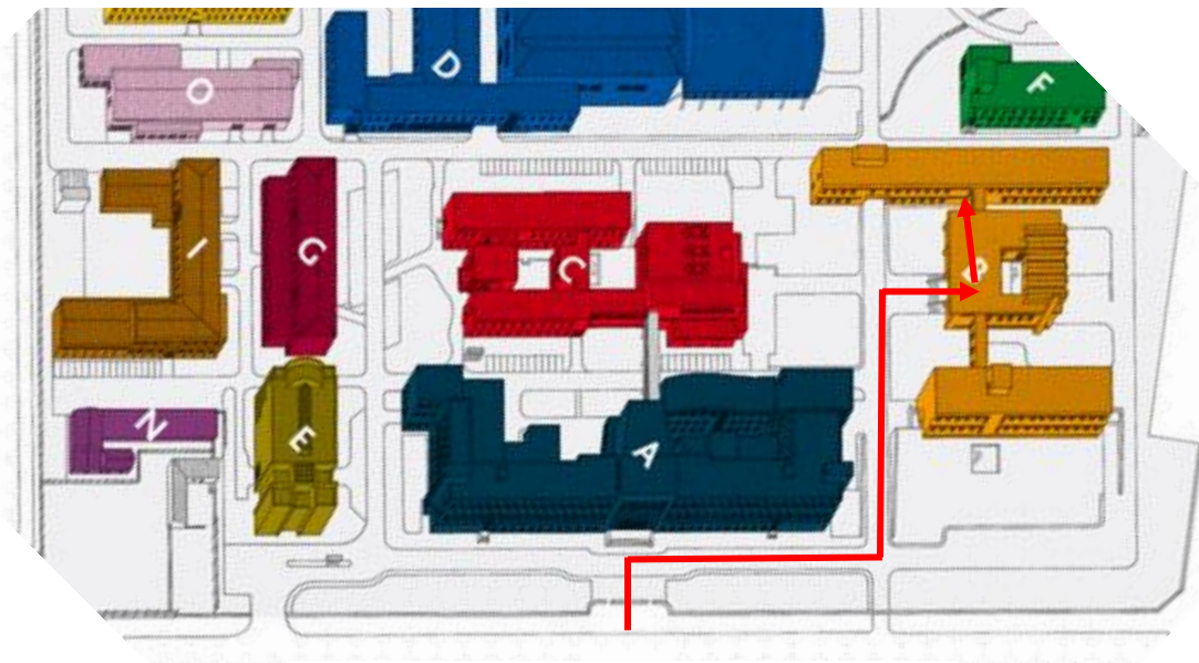
Av. do Brasil, 101 – entrada principal